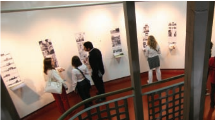
A Fiatalok feketén fehérén kiállítás a Siloban