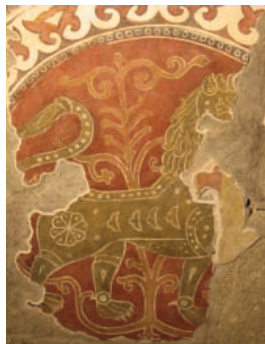
Az oroszlános falkép

A feltárás, a képet károsító fedőrétegek eltávolítása mikromilliméterről mikromilliméterre halad. Az előkerült stílárís jegyek, a festményt előkészítő karcolt rajzváltozatok, a festék és rétegei anyagának labora-