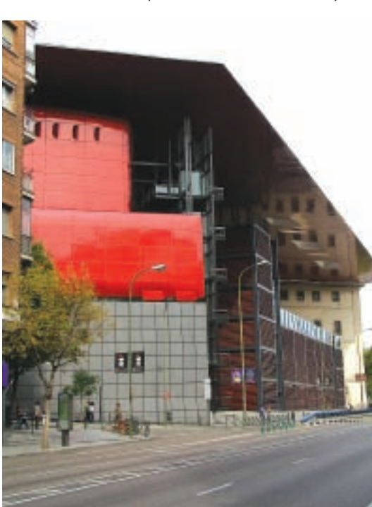
A Centro de Arte Reina Sofia új épülete (Jean Nouvel)